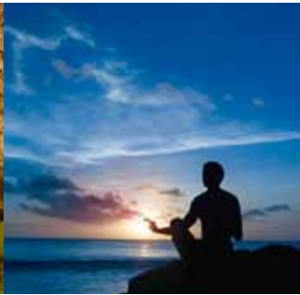
Das innere Haus