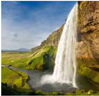
Der Fluss der Chakren