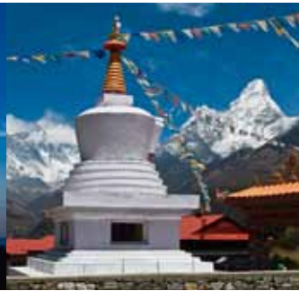
Der innere Tempel